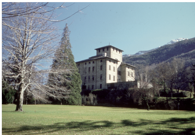
1. Vue du château. (F. Coluzzi)