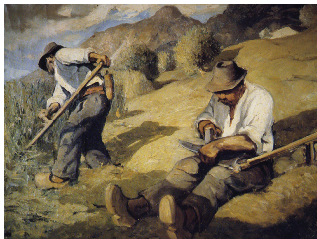
2. Italo Mus, Fienagione-taglio, huile sur toile, 1931.