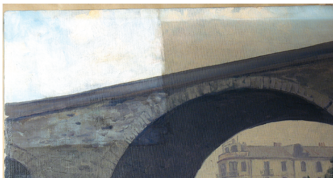
2. Particolare del dipinto durante il restauro. (S. Pulga)